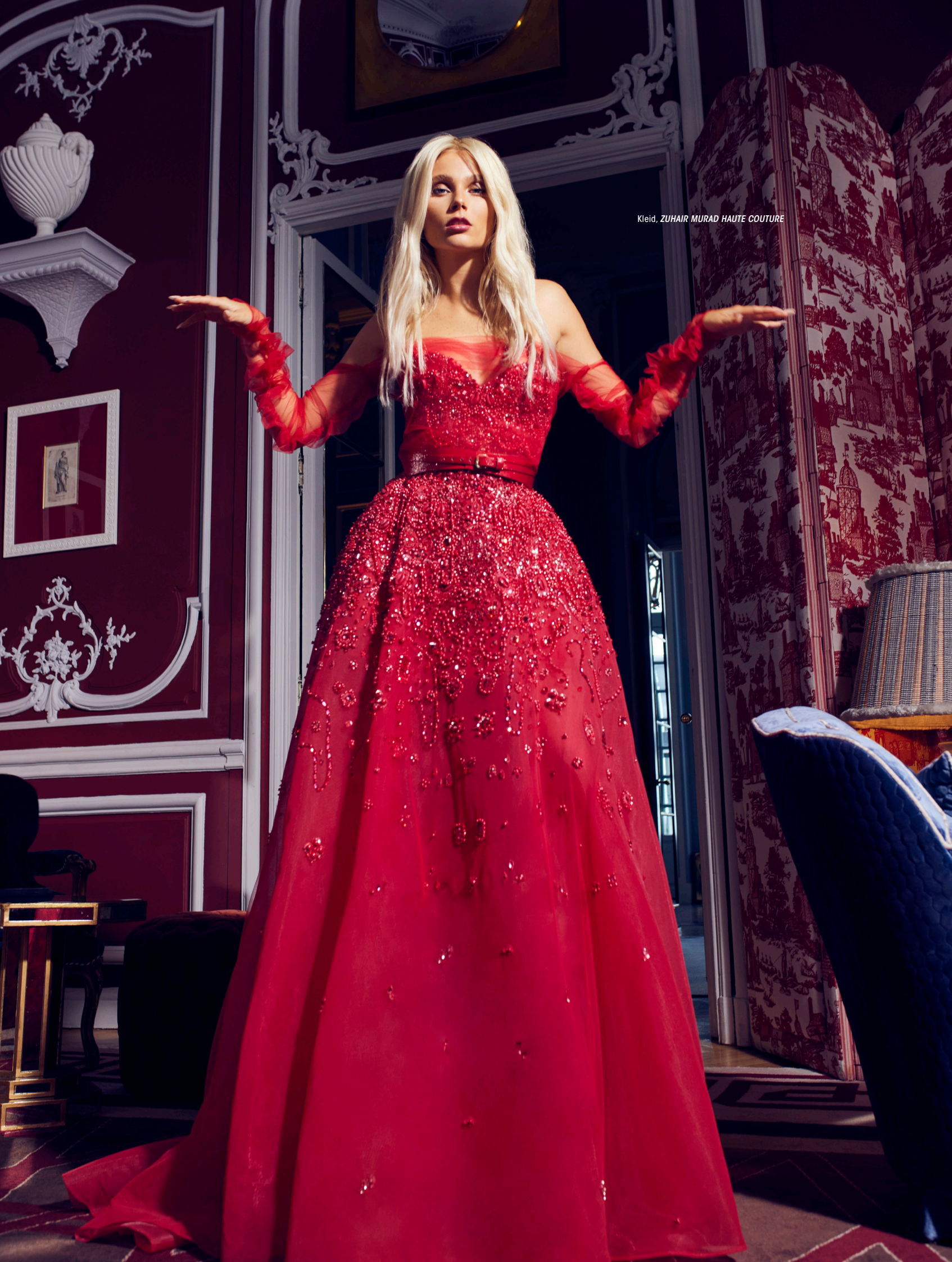
Kleid, ZUHAIR MURAD HAUTE COUTURE