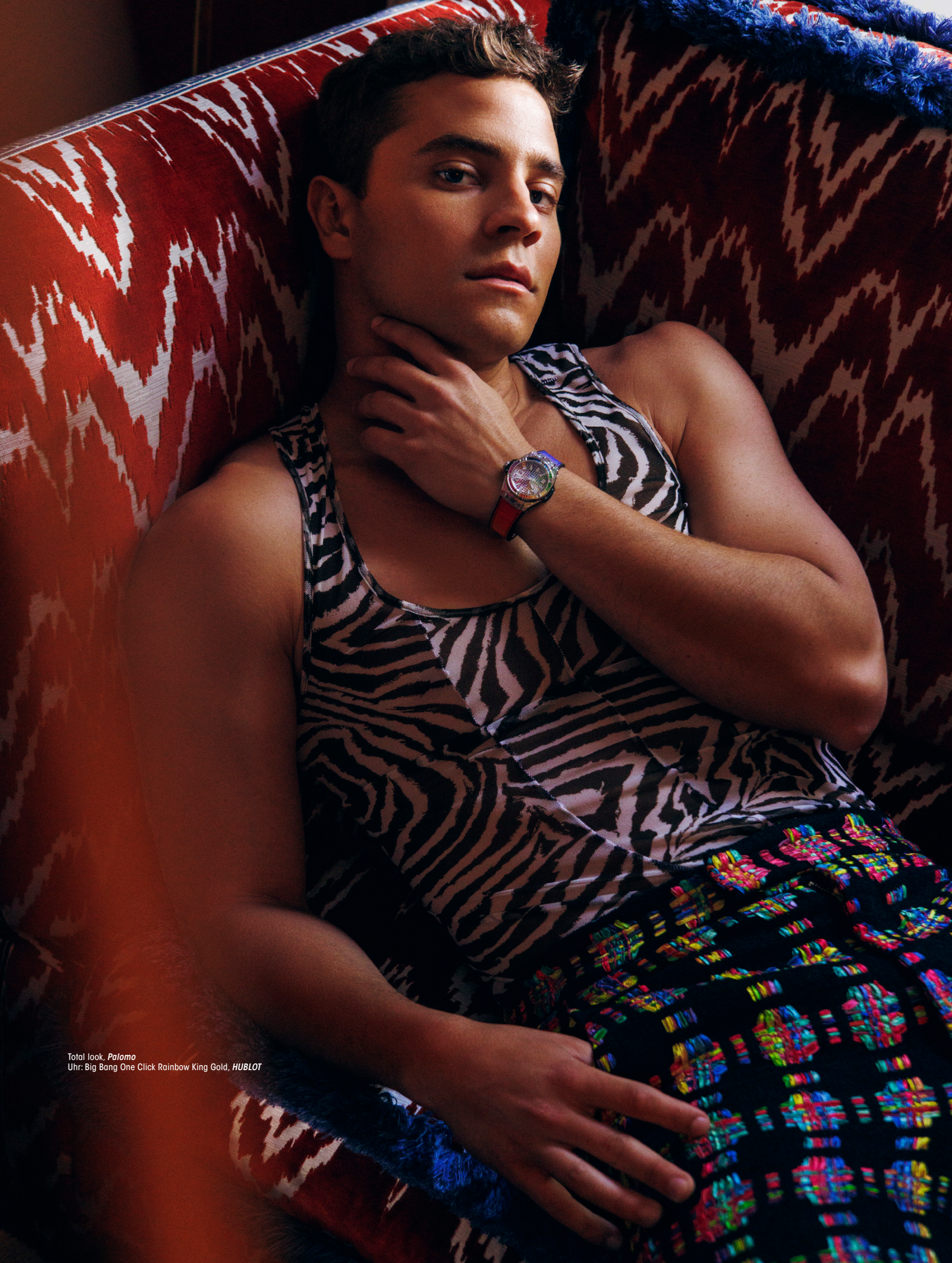
Total look, Palomo Uhr: Big Bang One Click Rainbow King Gold, HUBLOT