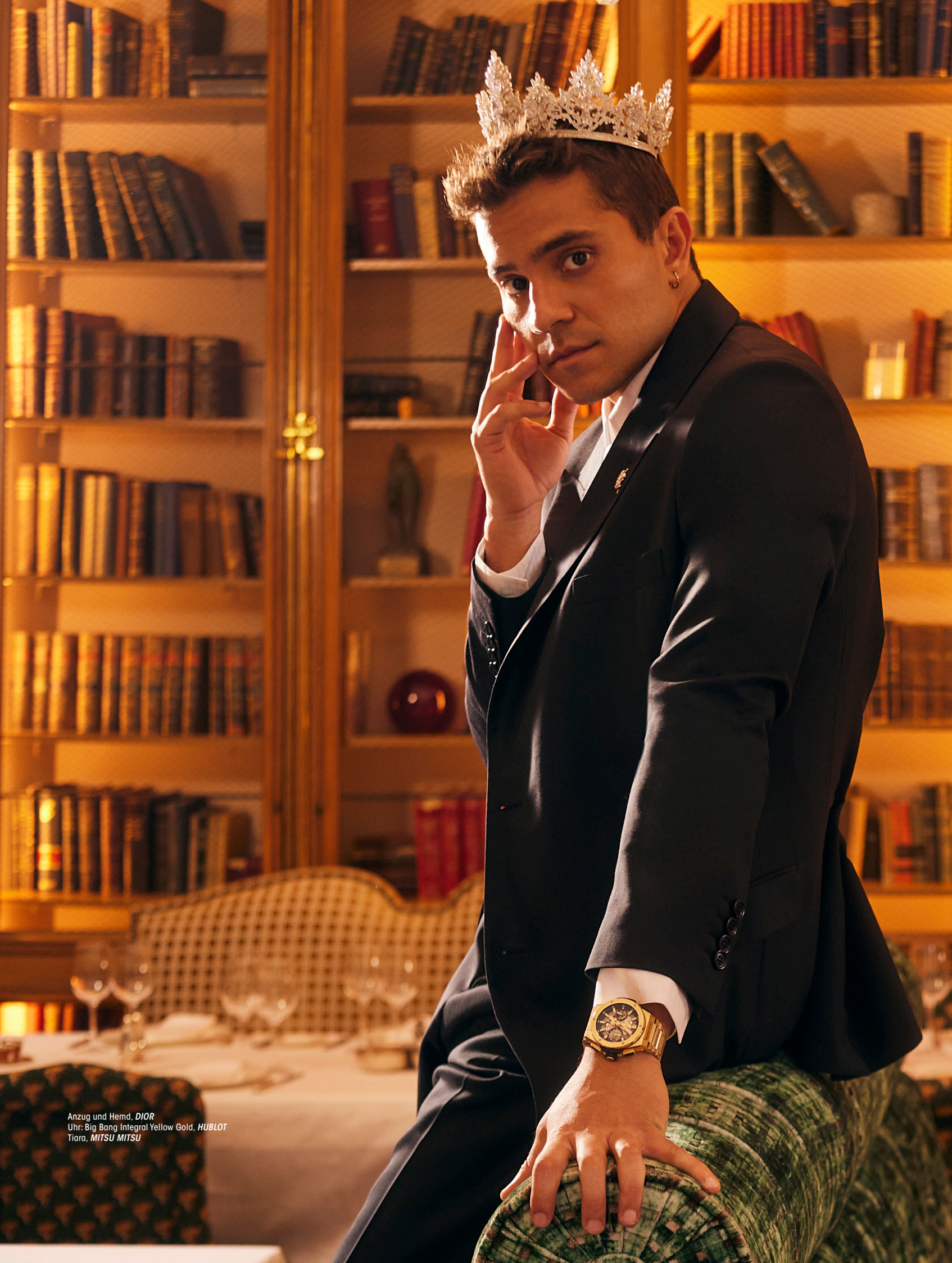
Anzug und Hemd, DIOR Uhr: Big Bang Integral Yellow Gold, HUBLOT Tiara, MITSU MITSU