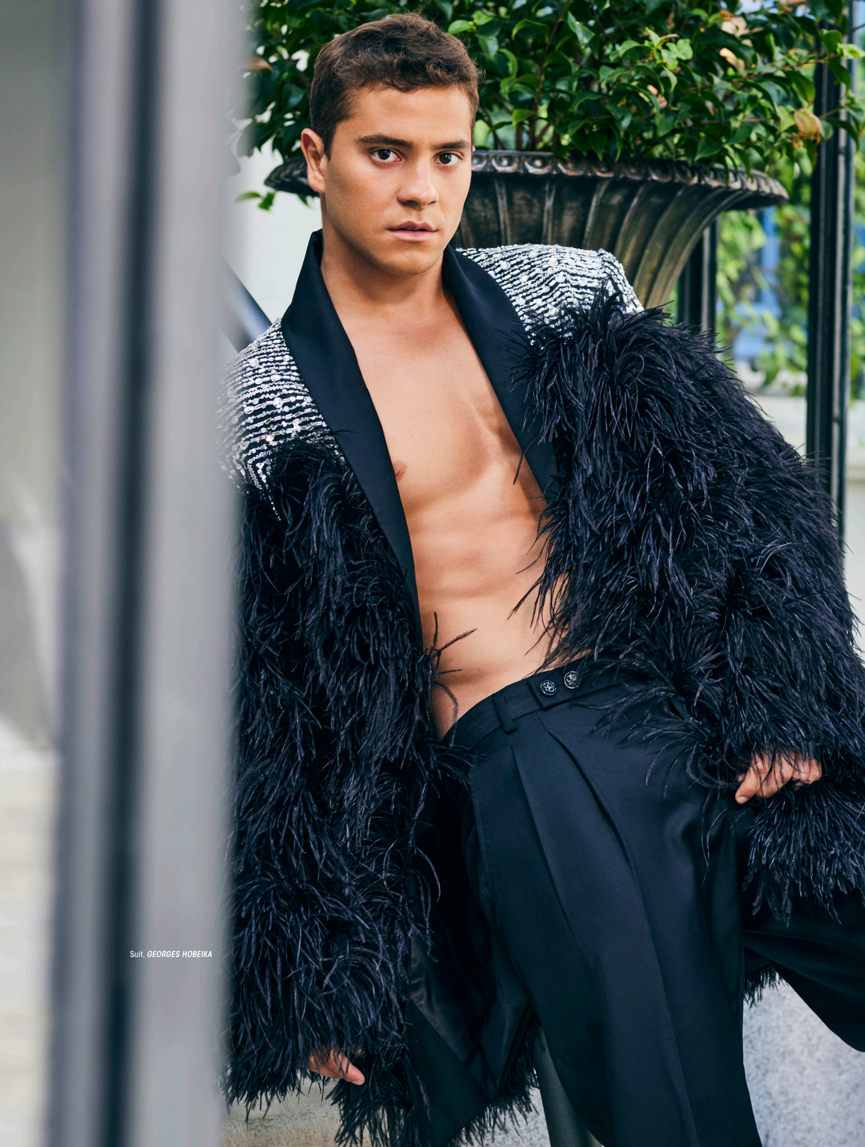
Suit, GEORGES HOBEIKA