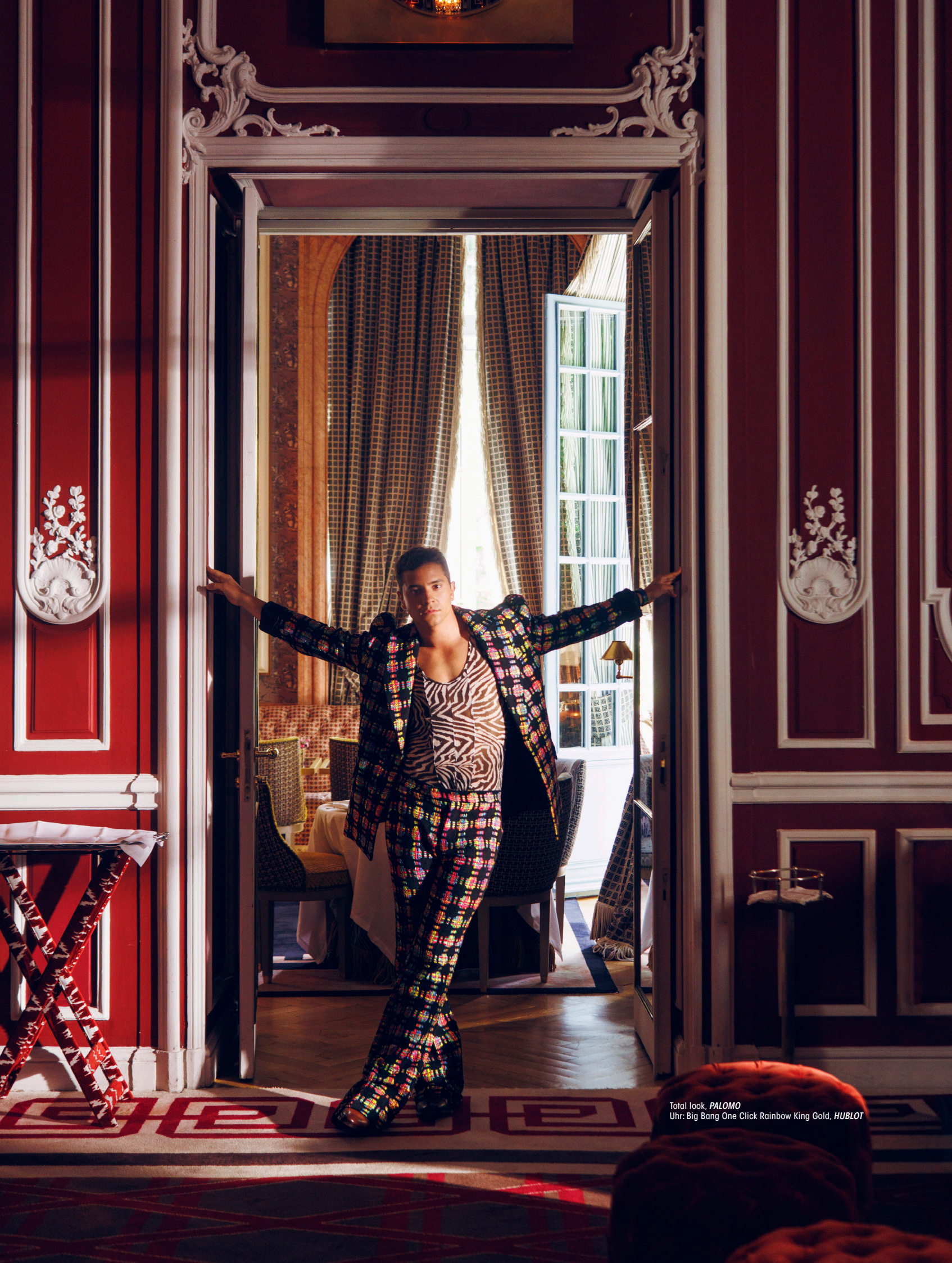
Total look, PALOMO Uhr: Big Bang One Click Rainbow King Gold, HUBLOT